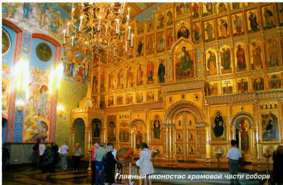
Главный иконостас храмовой части собора