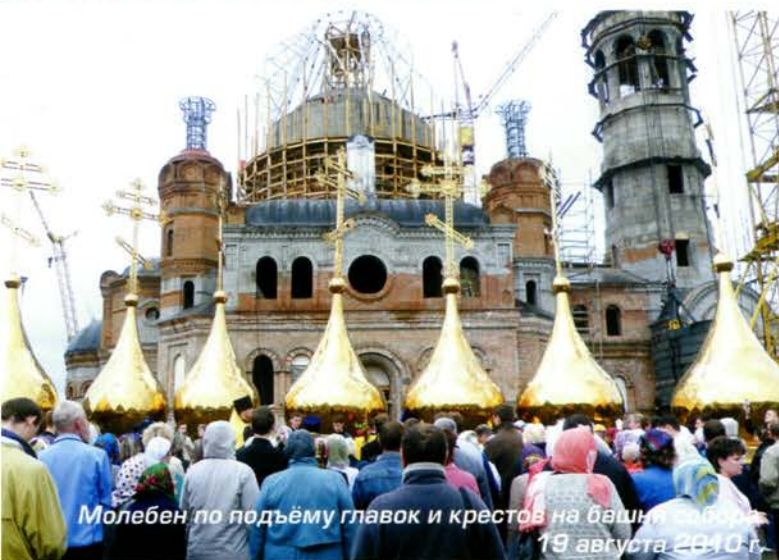
Молебен по подъёму главков и крестов на башни собора. 19 августа 2010 г.