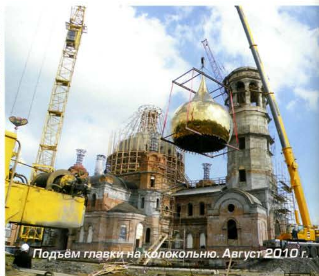
Подъём главки на колокольню. Август 2010 г.