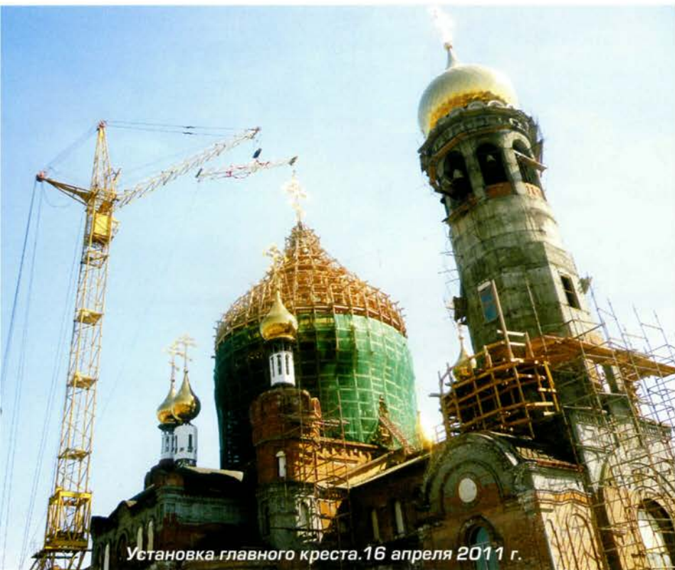
Установка главного креста. 16 апреля 2011 г.

Наконец, были завершены работы в интерьере. Художники закончили роспись храма. В крестильном храме была собрана уни-