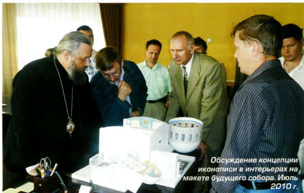
Обсуждение концепции иконописи в интерьерах на макетке будущего собора. Июль 2010 г.

Губернатор принял решение поднять архивы и выяснить, когда в них были отмечены первые печальные события на шахтах Кузбасса. Оказалось, что первые записи о погибших шахтерах датированы 1920-м годом. Когда подсчитали общее