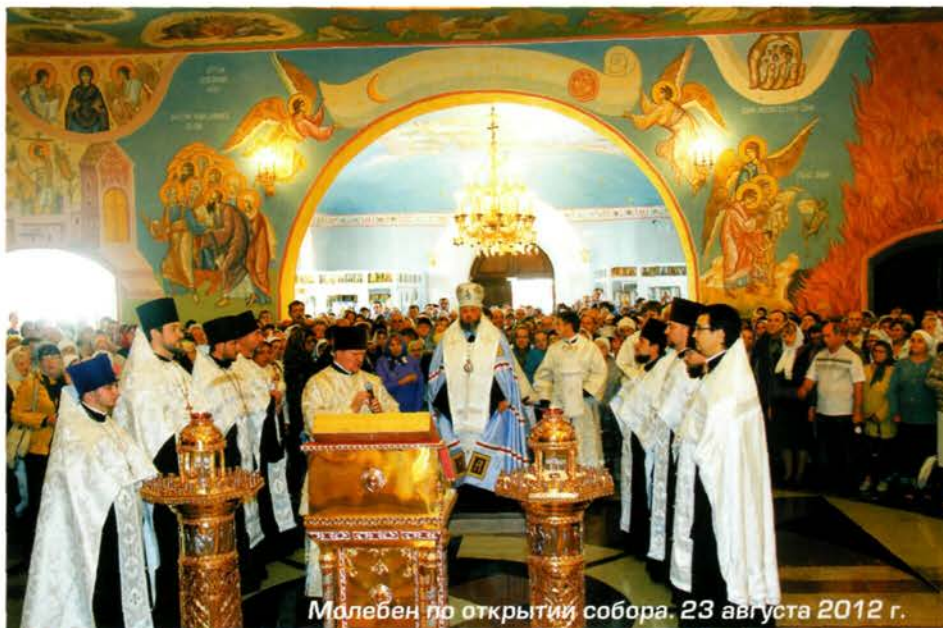
Малёбен по открытии собора. 23 августа 2012 г.

Записала Ирина Казанцева.