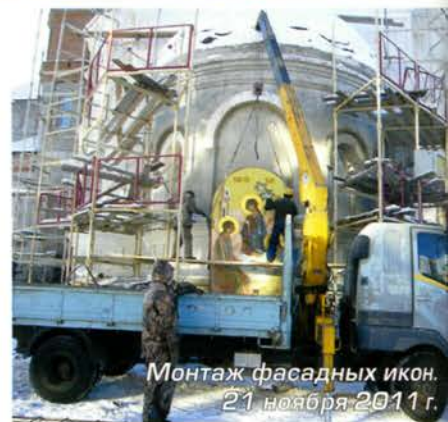
Монтаж фасадных икон. 21 ноября 2011 г.

В мае того же года началась роспись храма. В силу того, что храм посвящен памяти погибших шахтеров Кузбасса, на стенах появились росписи с изображением иконы «Покров Пресвятой Богородицы над Землей Кузнецкой» (этот образ был написан в 2007 году иконописцем из Новокузнецка Леонидом Ключниковым), а также великомученицы Варвары, которая в православной традиции почитается как покровительница